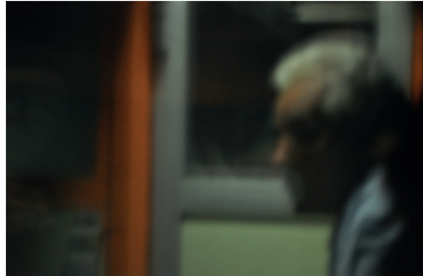
Atef Berredjem, Stranger on the Train , 2013