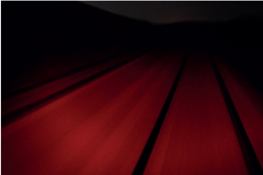
Atef Berredjem, Mythological Project: The Double Train Way , 2013