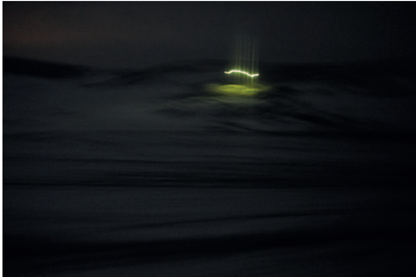
Atef Berredjem, Illegal Light , 2013